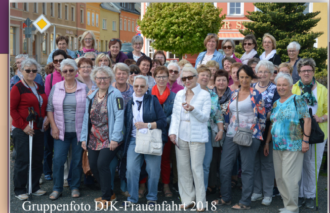
Gruppenfoto DJK-Frauenfahrt 2018

„Frauen in der Lebensmitte - Gutes tun, auch für mich?“